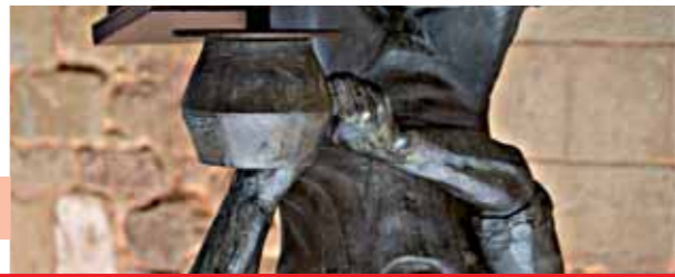
Bienvenue(e) à Navarrete,

Un village situé en pleine vallée du fleuve Ebro, très proche de la capitale riojana. Sa naissance au XIIe siècle sur la colline Tedeón est liée avec le Chemin de Saint-Jacques, et des divers monuments trouvés dans son territoire dynamique dans le présent. Tout au long de l'histoire ses habitants ont réussi à travailler leurs terres, les façonnant et les protégeant tout en extrayant soigneusement ses deux produits les plus représentatifs: le vin et la poterie. L'élaboration traditionnelle a été la base de son économie et un mode de vie qui, modernisé, a été conservé jusqu'à aujourd'hui.